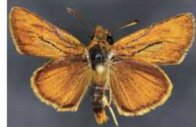
Thymelicus acteon , es muy común en casi todo el Parque volando de mayo agosto.

PARQUE NACIONAL MARÍTIMO TERRESTRE DE LAS ISLAS ATLÁNTICAS DE GALICIA