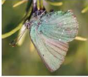
Calliphrys ari vuela de abril a mayo por hábitats muy variados, cantuñándose cuando está posada, gracias al verde de las alas. Es común en Ons y Salvora.