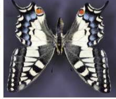
Papilio machaon se ve desde abril hasta agosto en los archipiélagos de Cíes y Ons.