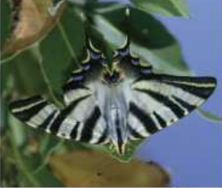
Zerynthia numina , el arlequin, está en peligro de extinción. Fue de verse de abril a mayo con un vuelo muy raso en el camino del Faro y la Campana del archipiélago de Cíes.

Los papilionidos son mariposas de gran tamaño con colores y diseños muy llamativos. De vuelo potente y rápido pueden recorrer grandes distancias.