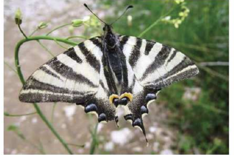
EL MUNDO DE LOS INSECTOS DE LAS ISLAS ATLÁNTICAS I

El Parque Nacional marítimo-terrestre de las Islas Atlánticas de Galicia está formado por cuatro archipiélagos localizados en las Rías Bajas: Cíes, Ons, Salvora y Corregada. Juntos albergan una gran diversidad en su medio natural. Los insectos tienen una importancia fundamental en los ecosistemas del Parque puesto que, aunque no han logrado colonizar el mar, constituyen más de las tres cuartas partes del total de especies descritas del reino animal. Tras su pequeño tamaño se esconde su gran papel ecológico, adaptabilidad a todo tipo de medios, versatilidad de diseños biológicos, abundancia de individuos... un mundo paí- tante de vida aun por descubrir. Mariposas y escarabajos son muy conocidos por el público en general. Sin embargo, en las islas existen otros grupos que merecen nuestro respeto y protección.