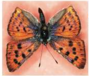
Lycaena alciphon , el manto bicolor, vuela en junio y julio por los prados soleados. Es fácil verla en Cíes, Ons y Salvora.