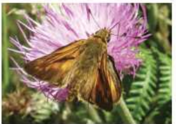
Ochloedes venatus , la dorada de orla ancha, vuela de junio a agosto.

Son pequeñas mariposas de cabeza grande, más ancha que el tórax por lo que casi recuerdan a las polillas. Suelen ser marrones o anaranjadas con diseños muy simples de tonos negros y blancos. Se alimentan principalmente de gramíneas. Está considerado muy primitivo en relación con los grupos primitivos de las nocturnas.