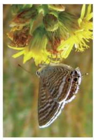
Lampides boeticus , puede verse volando entre las flores desde mayo hasta finales de agosto. Es muy frecuente en archipiélago de Cíes.

Por lo general se trata de pequeñas mariposas de diseños llamativos y brillantes con gran diferencia entre machos y hembras, siendo estas menos llamativas, lo que se conoce como dimorfismo sexual.